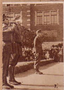
7. Iskolai városi közönség az esküvőn részt vevő VII. rendőrtanostálynak.