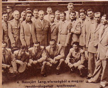
4. Hazajött Lengyelországból a magyar rendőrválogatott sportcsapat.